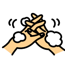
指の間にすりこむ