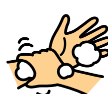
手首にもすりこむ