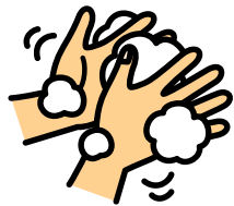
手のひらにすりこむ